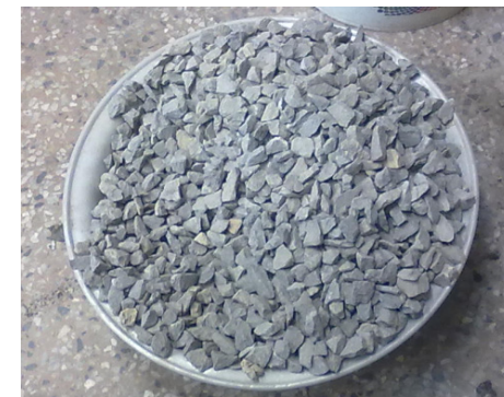
Figura 1. Agregado grueso (Grava) utilizado en el diseño de las mezclas

Caracterización de los agregados de Colconcreto. En las Tablas 1 y 2, se detallan los resultados de los ensayos realizados al material granular usado las mezclas, los cuales fueron: agregado grueso (grava) y agregado fino (conglomerado asfáltita), estos ensayos se hicieron teniendo en cuenta las normas de ensayo para materiales de carreteras del INVIAS 2007.