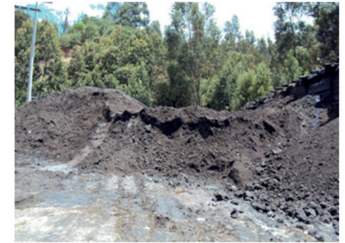
Figura 2. Cantera Santa Teresa - Pesca Boyacá, conglomerado de asfáltita.

El material de grava utilizado para el diseño de las mezclas asfálticas fue suministrado por la empresa COLCONCRETOS (Ver Figura 1) y la asfáltita (Ver Figura 2) fue suministrada por la cantera Santa Teresa ubicada en el municipio de Pesca (Boyacá) y el asfalto fue suministrado por el consorcio SOLARTE&SOLARTE.