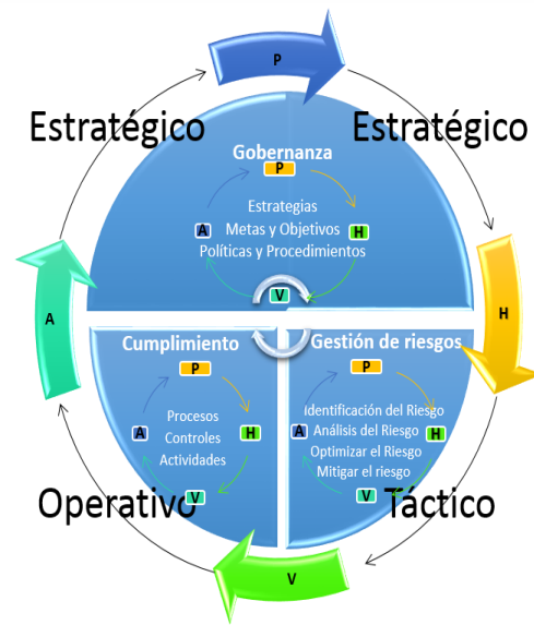
Figura 1. Modelo de gestión de riesgos de Proyectos de TI

definieron enfocadas desde tres puntos de vista estratégico, táctico y operativo. El estratégico con el componente de gobernanza en cuanto a las estrategias, metas y objetivos, políticas y procedimientos; el táctico todo lo correspondiente a gestión de riesgos y en el operativo todo lo correspondiente al cumplimiento con sus procesos, controles y actividades. Se definen los elementos del modelo de acuerdo a la normatividad y buenas prácticas mencionadas tomando el Ciclo PHVA de Deming (Planear, Hacer, Verificar, Actuar), en cada una de sus etapas.