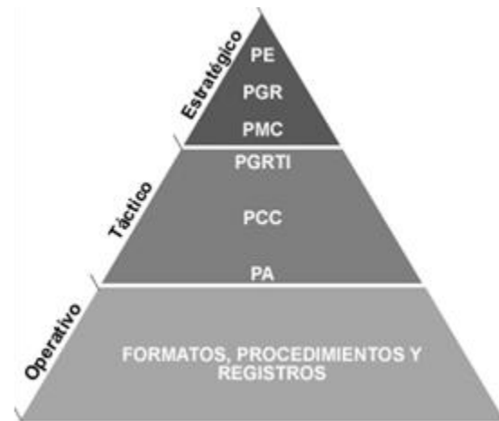
Figura 3. Modelo documental.

documentación debe incluir los métodos, fuentes de datos y resultados. Se define un modelo documental (Ver Figura 3) a nivel estratégico, táctico y operativo que incluye: La definición de la política y objetivos del modelo, su definición del alcance, la descripción de los elementos, relación y referencia de documentos, la definición de los documentos y registros del Modelo.