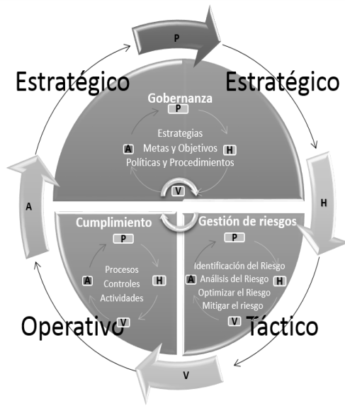
Figura 1. Modelo de gestión de riesgos de Proyectos de TI

Se aplica la normatividad y buenas prácticas a nivel estratégico con NTC ISO/IEC 27001; en el nivel táctico NTC ISO/IEC 27002 y NTC ISO/IEC 27005 y en el nivel operativo con NTC ISO 31000 y NTC 5254, siendo COBIT y PMBOK transversal en cada elemento.