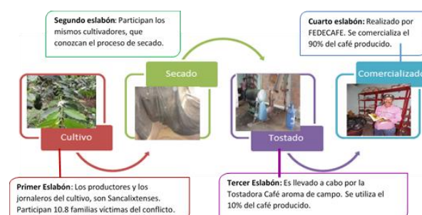
Figura 2. Cadena productiva del Café

Por consiguiente, el cultivo de café tradicional es el producto más destacado, cuenta con 1.811 has cultivadas, 1.115 caficultores y cada caficultor produce en promedio 1.7 toneladas al año, es decir 0.94 toneladas por ha. La cadena productiva del café del municipio, cumple los eslabones de sembrado, secado, tostado y comercializado, el cual sólo se lleva a cabo en el mercado local. (Ver Figura 2).